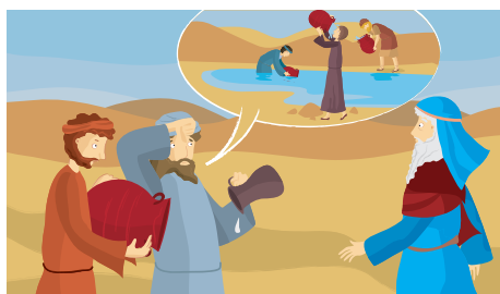
10. A Refidim soffrirono per mancanza d'acqua