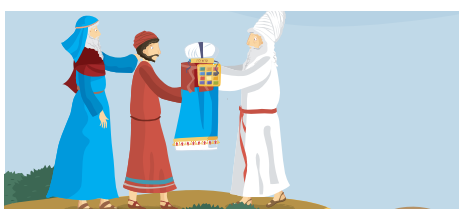
33. Monte Hor, dove morì Aharon