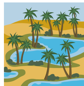
5. A Elim c'erano 12 palme e 70 fonti d'acqua...