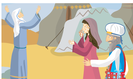
13. Chatzerot. Miriam fu colpita da tzara'at