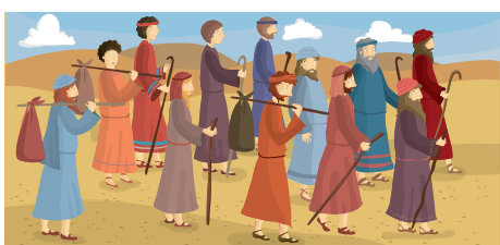
14. Dal deserto di Paran partirono gli esploratori