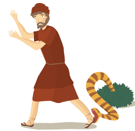
35. Punon, dove furono attaccati dai serpenti