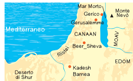
37. Rovine di 'Avarim, al confine con Moav