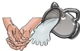
ורחץ (נטילת ידיים)

הרגע בו יצאנו מעבדות לחירות. כדי לזכור אותו אנחנו קוראים את ההגדה.