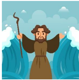
חציית ים סוף

בליל הסדר, אנחנו פותחים את הדלת ומחכים לו. משאירים לו כוס של יין.